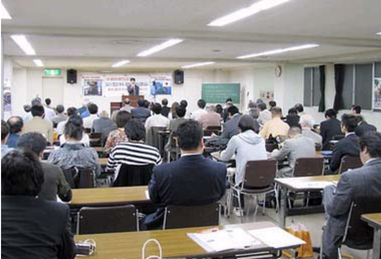
熱心に登壇社の発言を聞く参加者の皆さん

れから激減する。ではどうするかだが、私は核燃料の最終処理場を考えるべきだと訴えたが、島のマスコミからバカにしていると反発を受けた。しかし、経済的メリットだけでなく、処理施設がくればそれに伴って警備も強化しなければならず、国防上の視点でもても良いと考えている」などと語った。