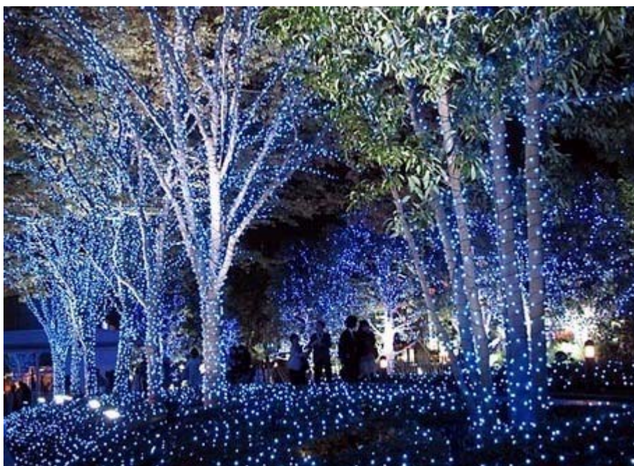
新宿サザンテラスはクリスマスバージョンに

前回掲載した画像が「国籍法改正案まとめW1K1」が配布している領布用チラシ1、上記はその2をテキスト化したものです。どちらもサイトからダウンロードして印刷できますので、お知り合いの方に説明かたがた配布して頂けたらと思います。