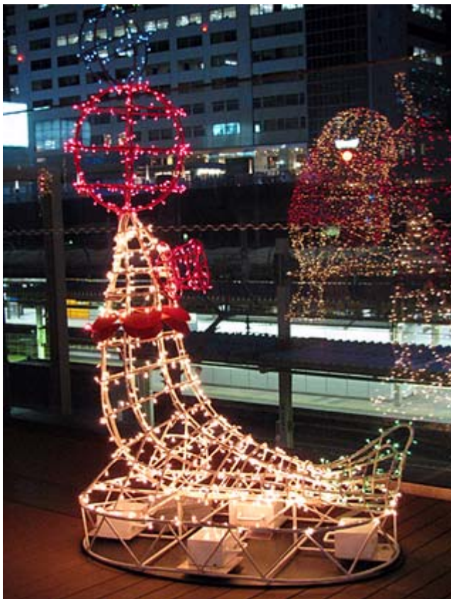
新宿高島屋ではオットセイが遊んでいます