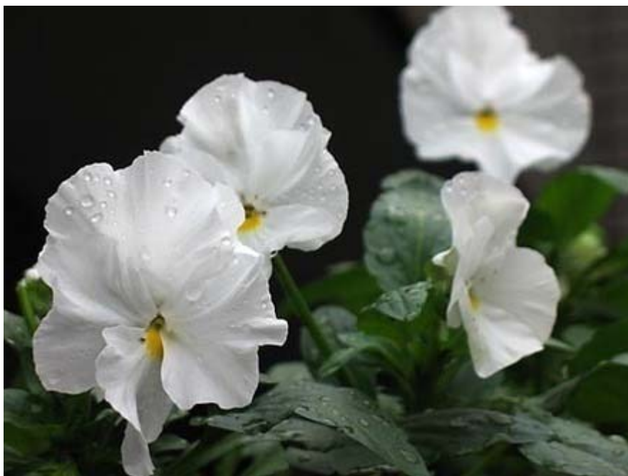
10月に植えたパンジーもかなり育ってきました。

・目先の売り上げほしさに売国政策に手を貸せば、それは間違いなく 売国新聞 ・ 売国放送局 に成り下がった事を意味する。理由はそれだけではない筈だが、となると、我々は変態毎日新聞を糾弾したように、産経新聞とチャンネル桜をのぞいたほとんどのマスコミを糾弾しなければならない。特にNHKは国民から 受信料 をとって 創価学会 からの広告出校はない準国営放送みたいな存在だ。しかし、報道していないのだ。この 国籍法改悪 はあの 人権擁護法案 と 外国人参政権 を足してもお釣りが来るほどの 重大問題 なのに、だ。