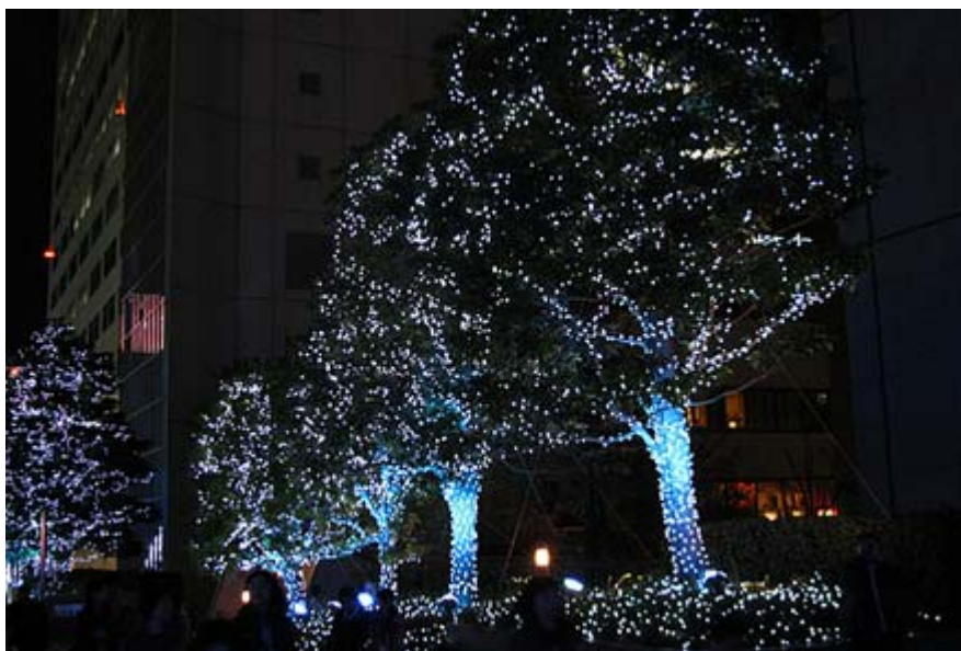
新宿サザンテラスのクリスマスイルミネーション

http://sankei.jp.msn.com/politics/situation/081201/stt0812012135002-n1.htm