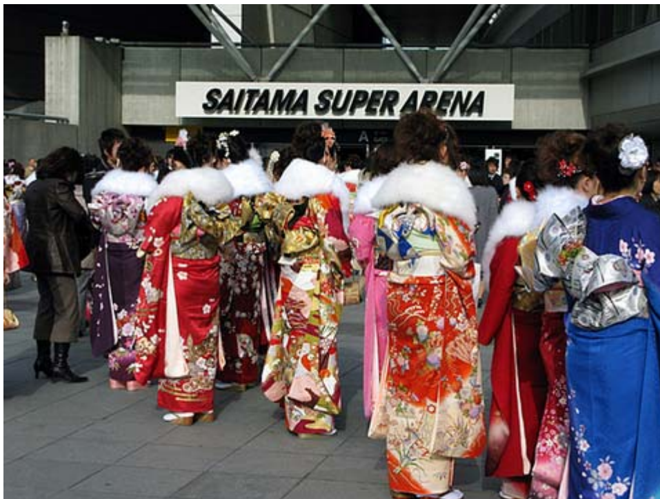
昨年の埼玉スーパーアリーナの成人式からスナップです

ところで、皆さんの振袖姿ですが、良くまわりの方とも見て下さい。振袖も帯も全く同じという人には会わないと思います。実はこれが驚くべきことなのですが、それだけ多品種少量生産がされている伝統の証なのです。世界がうらやむ振袖を着て晴れの日を迎えることのできる幸せを、是非、心にとめて下さい。