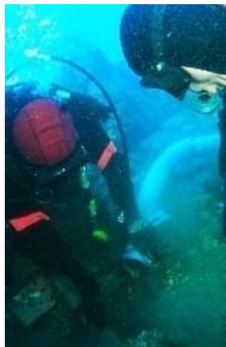
紀伊日報のニュース画像から

http://www.agara.co.jp/modules/dailynews/article.php?storyid=160274