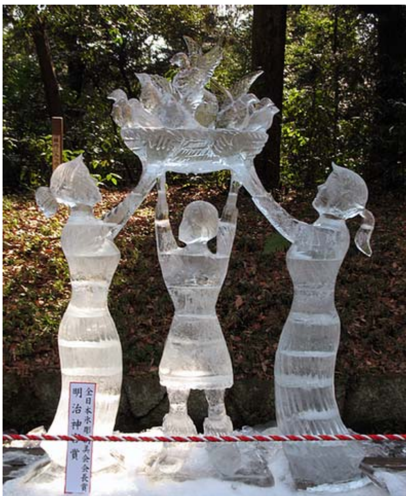
奉納全国氷彫刻展から(1月12日、明治神宮で)

村長 よし、早速それでいこう。調査では70-80%がもっと有効に使えと言ってるから、50%は協力してくれるだろう。うちの村民は村思いが多いから期待できるぞ！。