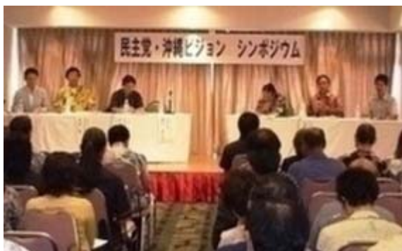
沖縄ビジョンシンポジウムの会場 ( 民主党 HPから)

http://www.dpj.or.jp/news/files/okinawa(2).pdf