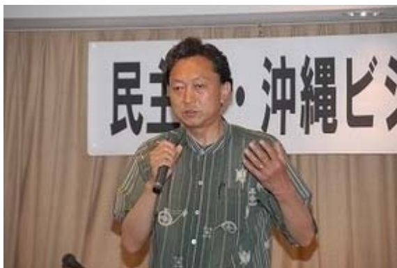
シンポジウムで挨拶する鳩山 民主党 幹事長

一般マスコミの報道通り、次期 衆議院 選挙で 民主党 が勝利して 民主党 政権が実現すると、この「沖縄ビジョン」は現実的な問題となります。「主権の委譲」、「主権の共有」を理念とする 民主党 は、そのパイロットケースとしてこの沖縄の将来像をかなり具体的に述べています。既に多くのブロガーの皆さんがエントリーに上げているので今更ですが、沖縄ビジョンとは何かについては、以下のフラッシュをご覧ください。