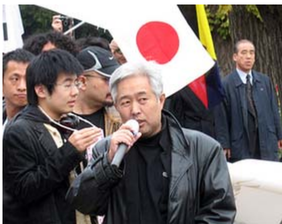
せと弘幸Blog『日本よ何処へ』の瀬戸弘幸氏