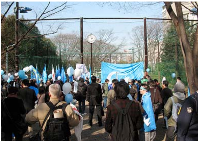
デモを終えての集会のスナップ