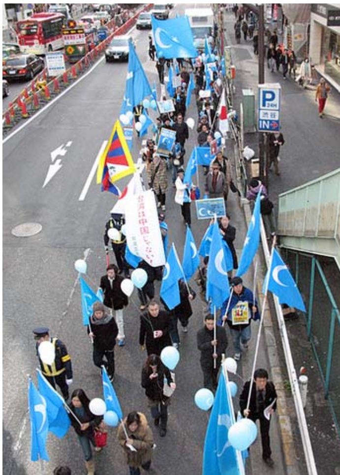
3・5キロの長丁場の支援デモとなった

日本ウイグル協会の主催によるグルジャ事件追悼「東トルキスタン支援デモ」が2月7日、渋谷の宮下公園で開かれ、渋谷から表参道、青山通り周辺3・5キロを支援者約100人とともにデモ行進、道行く人々に中国の核実験の非道さを訴えました。