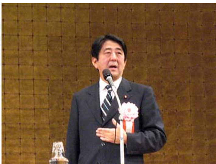
10年ぶりの復活を遂げた安部晋三内閣総理大臣

阿比留 はい。櫻井よしこさんは元々ニュースキャスター出身ですが、拉致家族問題に熱心に取り組む一方で、いわゆる保守政治を代表するオピニオンリーダーとしても著名な方です。また以前から安倍総理の考え方を支持してきた人として知られてきた方で、今回は総理のたつての要請に根負けしてはじめて引き受けたそうです。文字通り姉さん女房役となります。