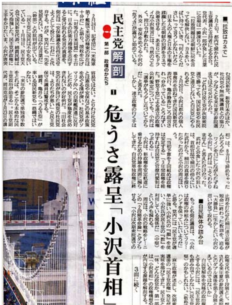
京の産経新聞は読み応えがありました。久しぶりに納得です。

怒りが爆発しそうです。ふざけるな、と云いたい！ 。この発言は日本国民の一人として許せない、小沢党首はテレビカメラの前で日本国民に土下座して謝罪し、発言を撤回すべきである。この男は 拉致事件 の本質が何であるかが全然判っていない。