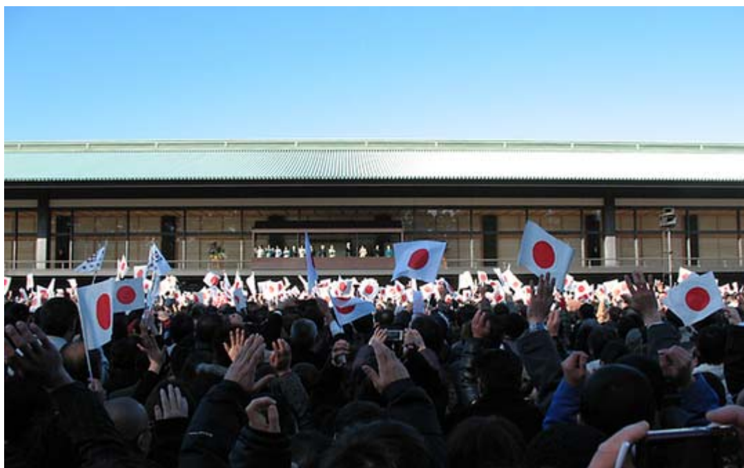
ちょうど「天皇陛下万歳！」のシーンです。1月2日の新年参賀で。

今上陛下の御即位二十年の佳節に当たって、私たちは日本という国がこの世界のなかで、いったいどのような特徴を備えているものか、日本の国柄について想いをめぐらせたい。