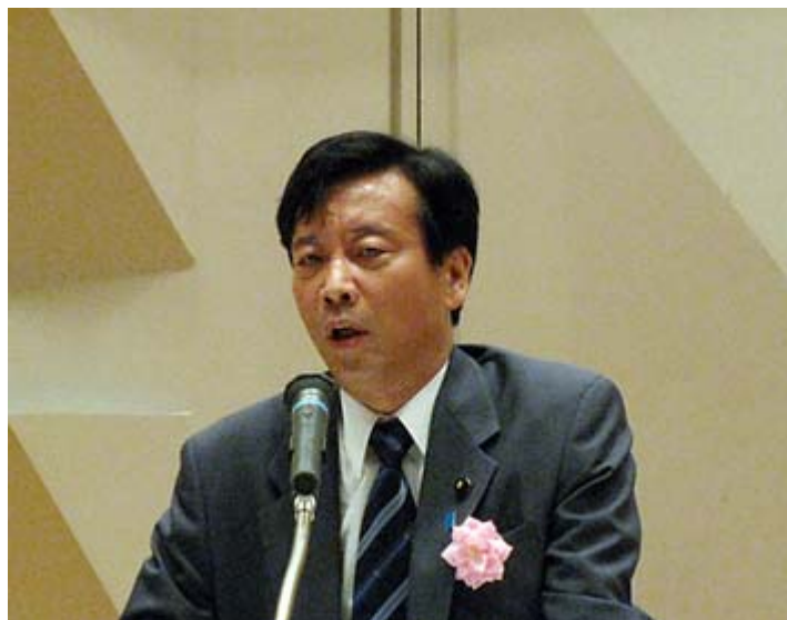
昨年10月16日に開催された日教組を糾弾する緊急国民集会で挨拶する土屋たかゆき議員

http://www2u.biglobe.ne.jp/~t-tutiya/enter.html