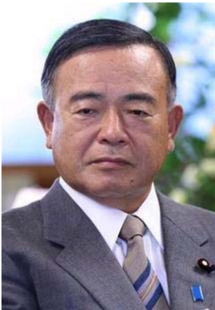
テレビ朝日を放送法違反で告発した中山成彬議員

また、番組は「検定意見の撤回を求める側に沿った放送」が約43分、「対立している側に沿った放送」約3分30秒と明らかに放送時間が一方的で公正でないとし、間違いの撤回と謝罪を求めた(文責筆者)。