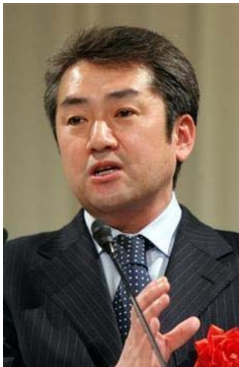
「子どもの権利条例」は 人権擁護法案 の子ども版であると警鐘を鳴らす八木秀次教授

この各市町村などの地方自治体が定める条例は、 日本国憲法 と日本の法律に抵触しない限りは、独自に制定でき、地方の法律と化しています。実際は抵触する部分もあると思ってますが。上記の正論で指摘している広島市は、市長が旧社会党出身の秋葉忠利ですから、余程の気合いと覚悟で反対運動を進めないと、これに「命をかけている」という条例制定が実現してしまうかも知れません。