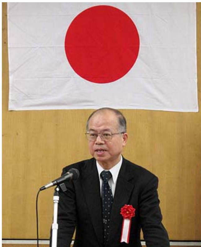
外国人参政権に明確な反対をしている日本大学の百地章教授

教授はまた、この問題の解決のためには、「国家とは政治的運命を共にする国民の共同体であり、国民とは国家の構成員として国に永久忠誠義務を負うものである、との基本認識を日本人はもっとしっかり持つべきだ」とも指摘、外国人にも地方参政権を認めようとしている民主党の動きを牽制した。(文責 花うさぎ)