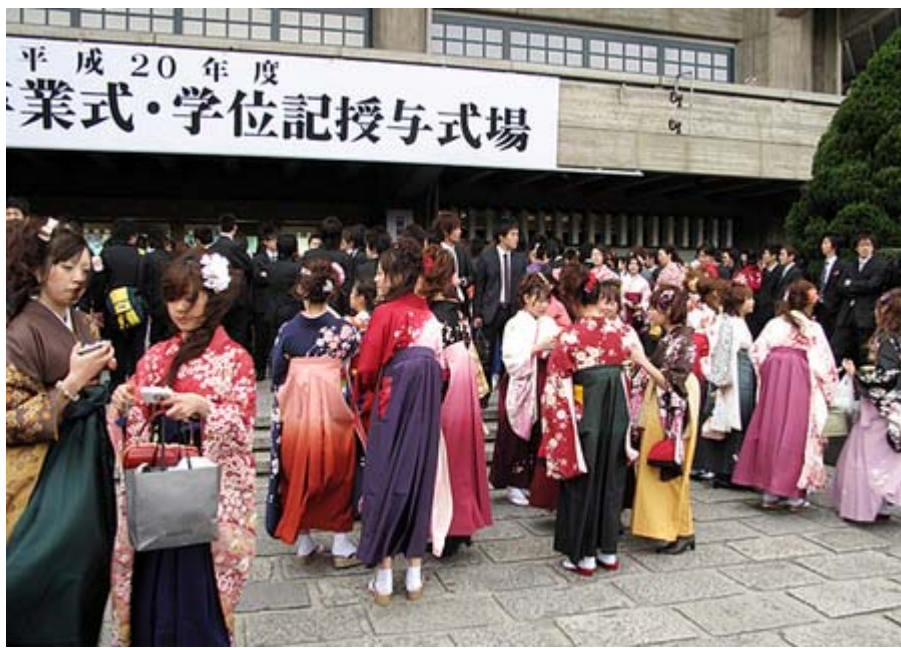
今は卒業式のシーズン(22日、日本武道館の専修大学で)

じゃあ、 民主党 が政権をとったらどうなるのか。私がこの間まで都議会 民主党 の三役にいるとき(三期連続)は、反石原などというのは一言も出てこなかった。ところが私が変わったとたんにオリンピックがどうのこうのとか、反石原などと言うようになったんです。まあ 自民党 も低脳ですよ、 民主党 も低脳な奴が多い。しかしそれを選んだのは皆さんではないですか。