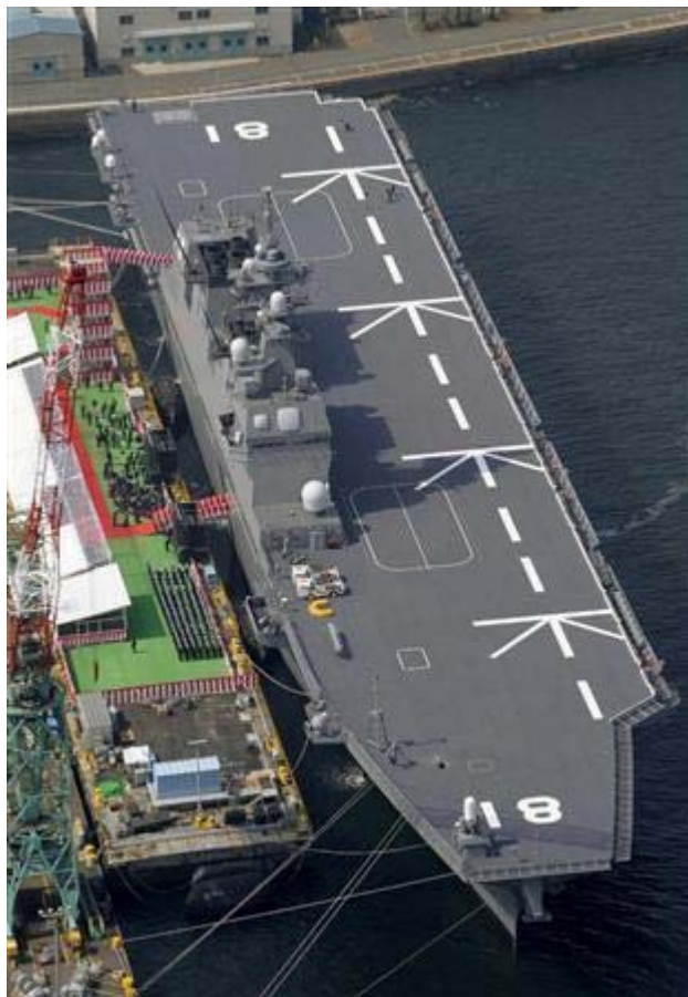
竣工して海上自衛隊に引き渡されたヘリ空母

その骨子は、(1)日米両国が「共同」で活動中、米軍艦艇に危険が及んだ場合、防護できるようにする(2)米国に向かうかもしれない弾道ミサイルを撃ち落とせるようにする(3)国際平和活動に参加中の他国部隊・要員が危急に陥った場合や活動への妨害排除に向けた武器使用を容認する(4)国際平和活動において、武力行使した活動参加国に対する後方支援禁止を再考する一ことの4点であります。