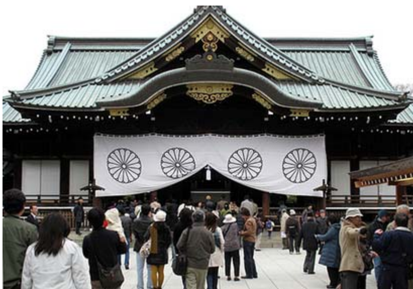
靖國神社で時を過ごしていると心がやすまります

昨日の 硫黄島 遺骨収集と元日本兵「 高砂義勇兵 」の英霊記念碑のエントリーをアップしてから、思うところあって靖國神社に参拝してきました。靖國神社もさくらまつりの初日とあって、境内には様々な露店が出店し、いろいろなイベントが開催されており、寒さにもかかわらず多くの参拝客で賑わっていました。