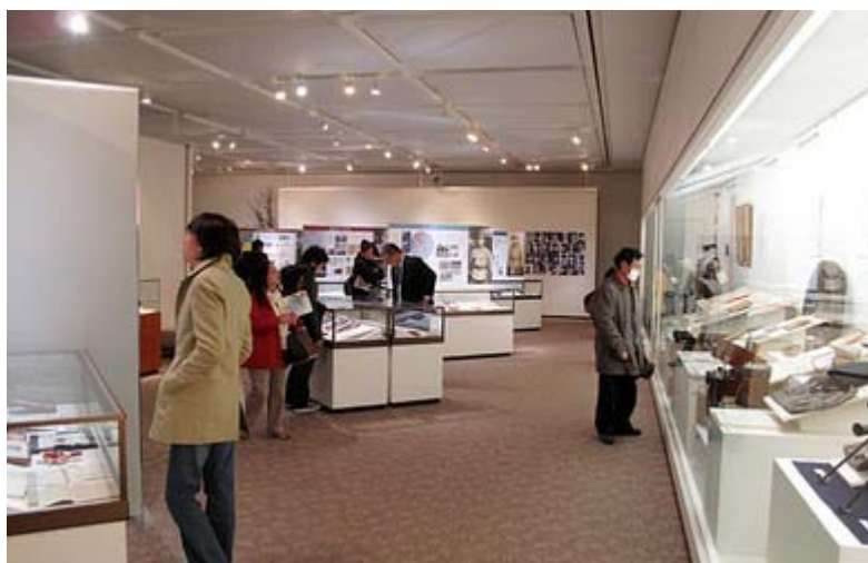
特別展の会場風景のスナップです。

私も入場料の300円を払って見てみましたが、ご覧のような貴重な遺品の数々が展示され、改めて命をかけて日本を護った英霊の思いを知らされた思いがしました。長期間にわたり開催されてますので、皆様、是非一度靖國神社に、そして 遊就館 を訪れて見て下さい。