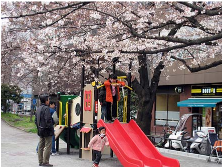
こちらは市ヶ谷土手通りの桜並木のスナップです。