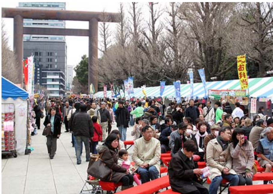
普段は静かな靖國神社も現在はご覧の通りの賑わいです

本日から「千代田のさくらまつり」がはじまりました。来月4月5日(日曜日)まで開催されますが、東京は開花宣言以来、あいにく寒い日が続き、この調子だと来週の土日(4月4-5日)が桜の満開になりそうな気配です。