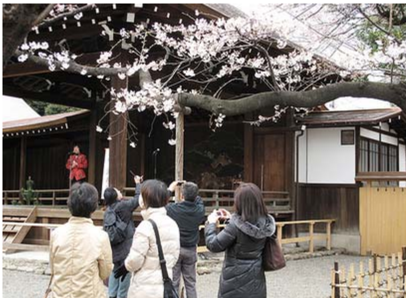
この桜の木が東京の開花宣言を決める標準木です。

私も入場料の300円を払って見てみましたが、ご覧のような貴重な遺品の数々が展示され、改めて命をかけて日本を護った英霊の思いを知らされた思いがしました。長期間にわたり開催されてますので、皆様、是非一度靖國神社に、そして 遊就館 を訪れて見て下さい。