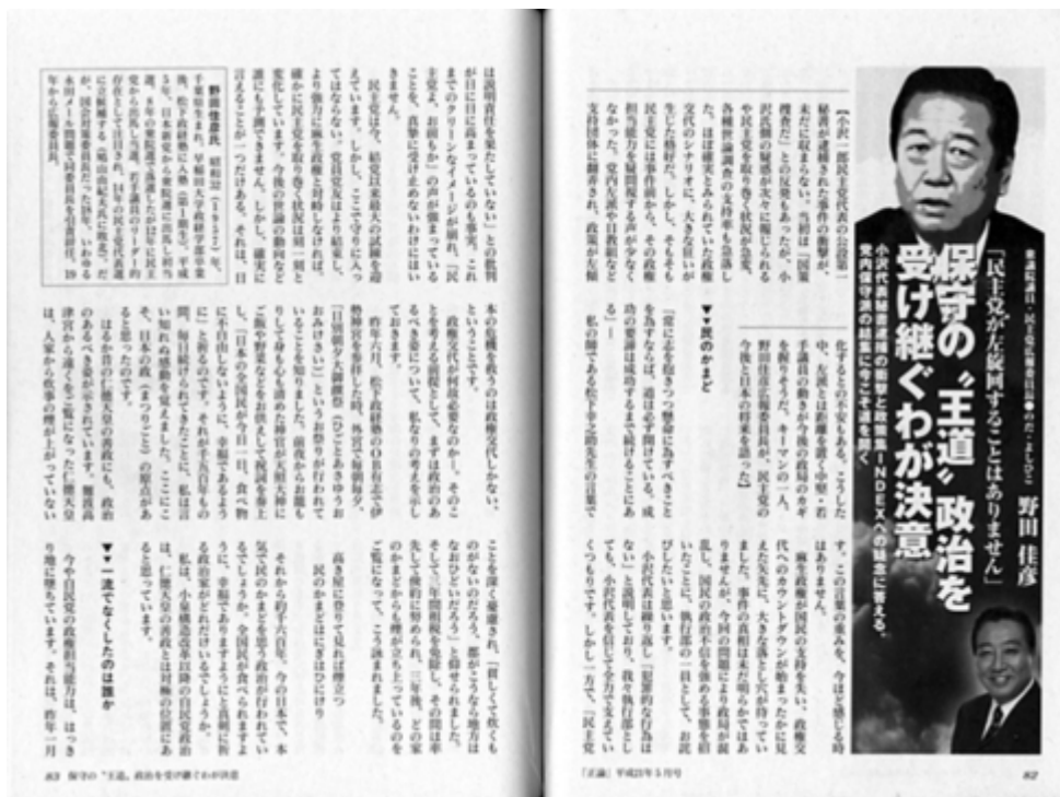
正論五月号は内容も濃いです。680円で好評発売中です。

はじめに「 民主党は官僚主導の政治を打破し、天下りは禁止され、不要な公益法人は即刻廃止されます 」という部分は大賛成です。これに反対する国民は甘い汁を吸っている当事者以外はいないでしょう。その志は良しなのですが、ちょっと待った、だからといって反日政権を許すわけにはいかないよ、というのが私の気持ちなのです。以下の引用は正論五月号(P82-P90)からです。