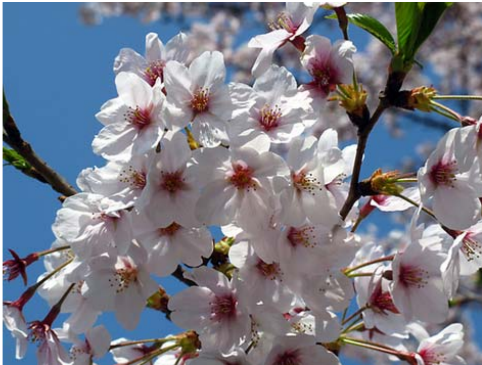
神田川の桜をマクロ撮影(4月6日)