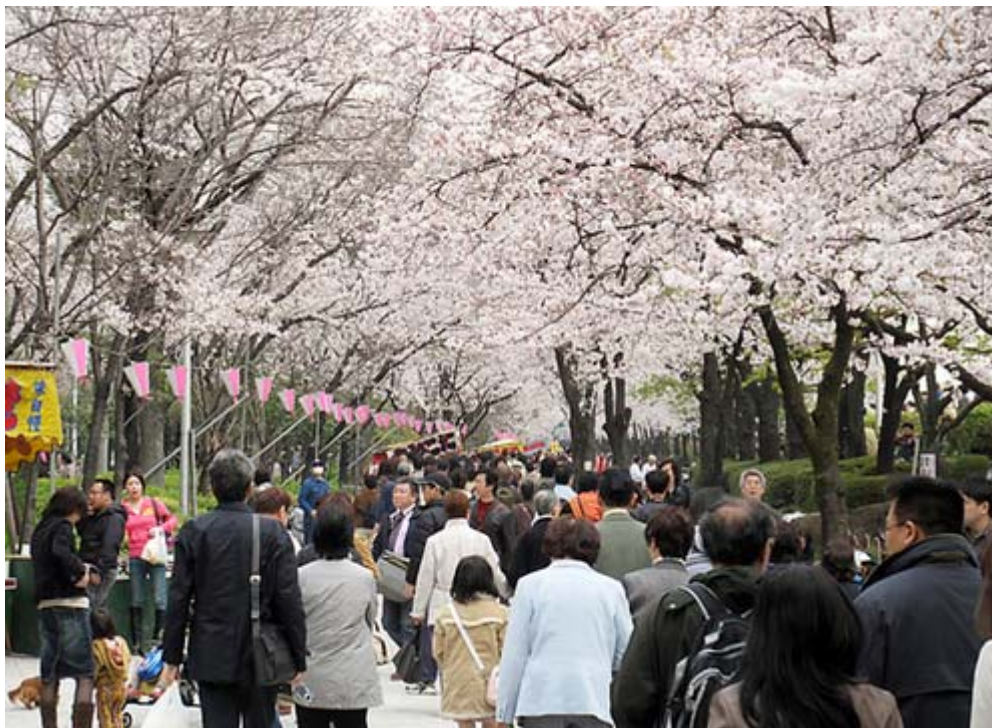
隅田公園の桜も満開です。ここも人出が多いですね(4日撮影)

この二つのニュースは、もっと多くのメディアで取り上げるべき内容のものですが、NHKをはじめとして無視しているのか拡がりません。中川発言などは、本来なら朝日や毎日あたりが脊髄反射して「叩く」筈ですが、さすがに今回は分が悪いと感じているのでしょうか。代わって本音(政府の毅然とした対応が面白くない)が出ているのがこの記事です。