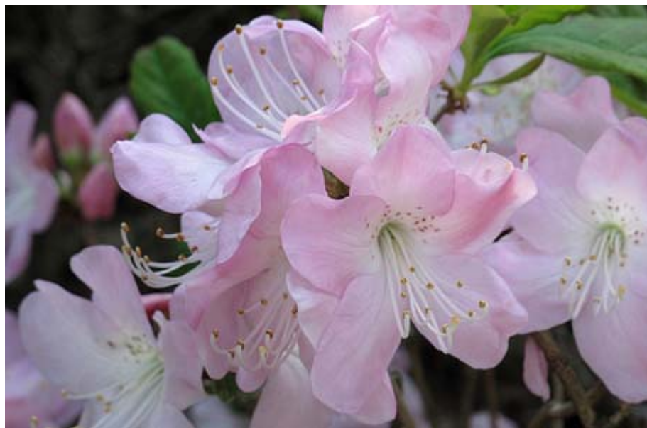
文京区の根津神社ではつつじ祭りがはじまっています(4月11日撮影)