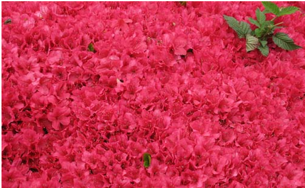
新宿御苑は八重桜が終わるとこれからツツジの満開を迎えます

・小沢氏は次期衆院選について「政権交代可能な議会制民主主義を定着させるという願いが、もう少しで達成できる」と強調。その上で「私も15年前、このままでは国民のための政治はできないと自民党を離党し、今日まで頑張ってきた」と述べ、政権交代へ意欲を表明した。産経が配信した記事だ。こらこら、そんな見え見えの綺麗事はもういいから、ネコババした政党助成金を早く返せよ。西田昌司議員がこの問題を追及した時の民主党議員の酷いヤジ、この党は自浄能力は既になく、心底腐っている。