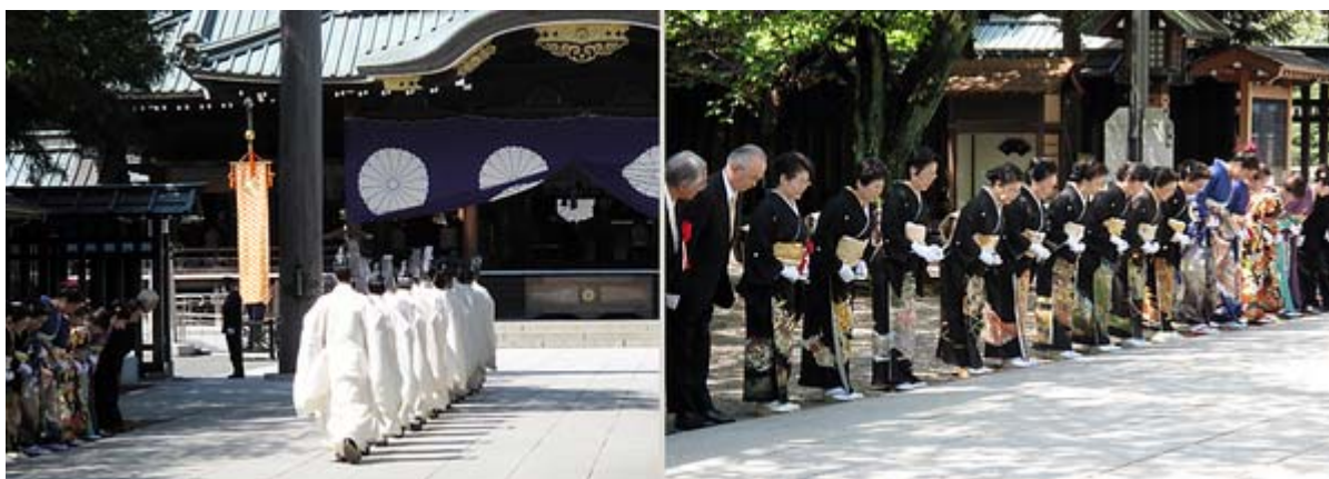
神職の参進、と第一礼装で出迎える関係者の皆さん。

春季例大祭の期間中、境内では、各種奉納芸能、特別献華展やさくらそう展などの奉祝行事も繰り広げられます(HPから)。