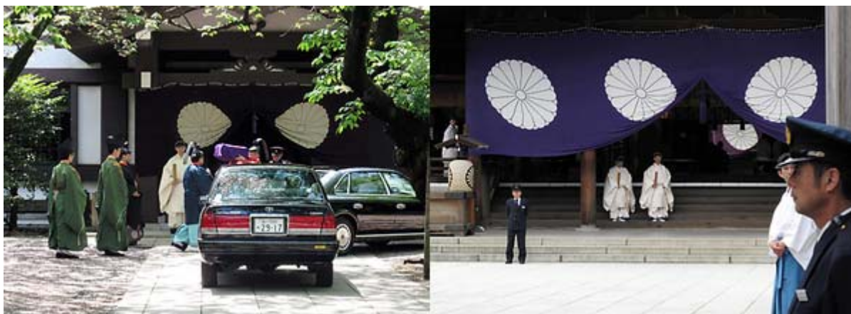
天皇陛下の使い・勅使は二台の車で参道を直接齋館に乗り付けてこられました。

私が着いたのは十時少し前で、拝殿で参拝したときにちょうど「国家斉唱を行います、皆様ご起立下さい」というアナウンスが本殿から流れましたので、私もその場で直立不動の姿勢で二度、「君が代」を斉唱しました。