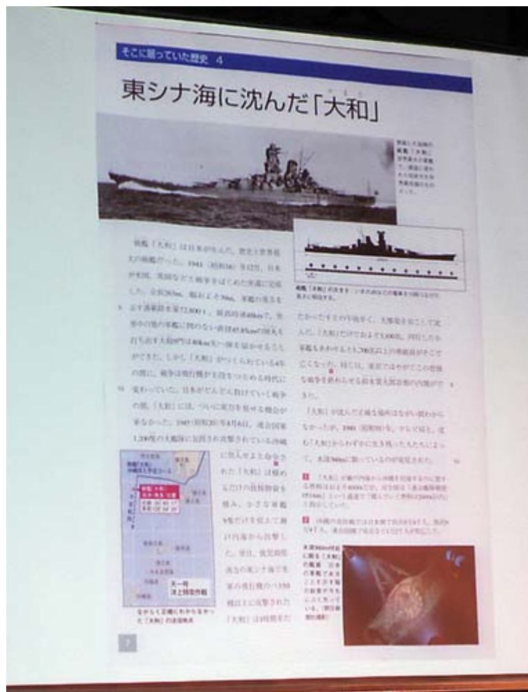
教科書にはじめて取り入れられた「戦艦大和」のページ

そして負けて十年、昭和三十年、1955年には心ある日本人がいました。自民党が結成されました。その自民党の綱領第一項は「憲法改正」ですよ。それなのに経済的な豊かさに心を奪われていまだに手もつけていないのです。