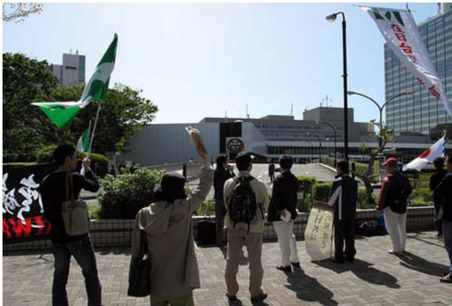
NHK包囲網は大分煮詰まってきました。

そこで、 自由民主党 「日本の前途と歴史教育を考える議員の会」は、国民が当該番組に抱いた疑問に則して下記の質問をします。尚、国民が、報道番線制作者の基本的姿勢を知る為と、貴社番組の質の向上を実現するため、質問は、誤解が生じることのない方法として、択一で回答して頂くことにしました。宜しく願いいたします。