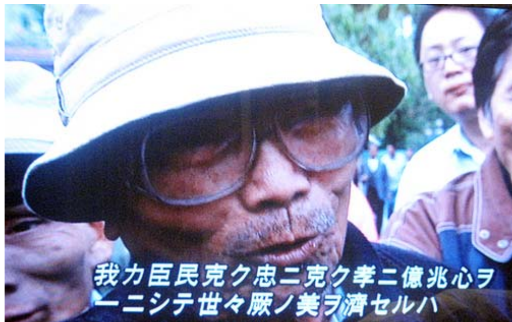
教育勸語をすらすらと語って見せる日本語族の出演者の一人。日本を恨んでいたら「教育勸語」は無いでしょうね。