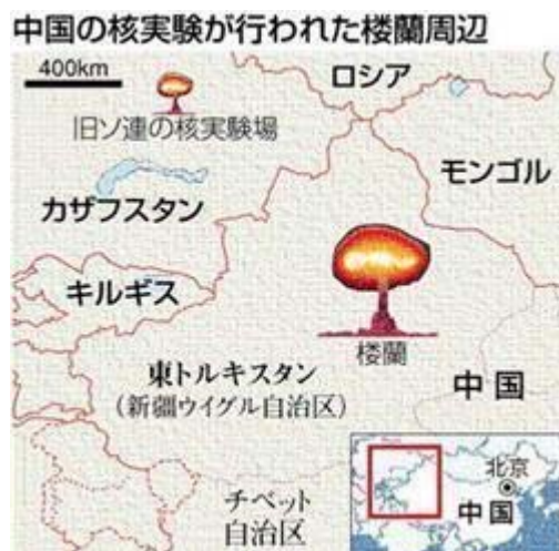
楼蘭遺跡周辺は核の砂漠という恐ろしさ

シルクロードの観光地では、46回総威力22メガトンの核爆発が、 中国共産党 により実施されていました。危険な核爆発は、1964年にはじまり、1996年まで続けられていたのです。そのため楼蘭遺跡周辺は核の砂漠と化しています。その周辺を観光地とすることは、許されることではありません。