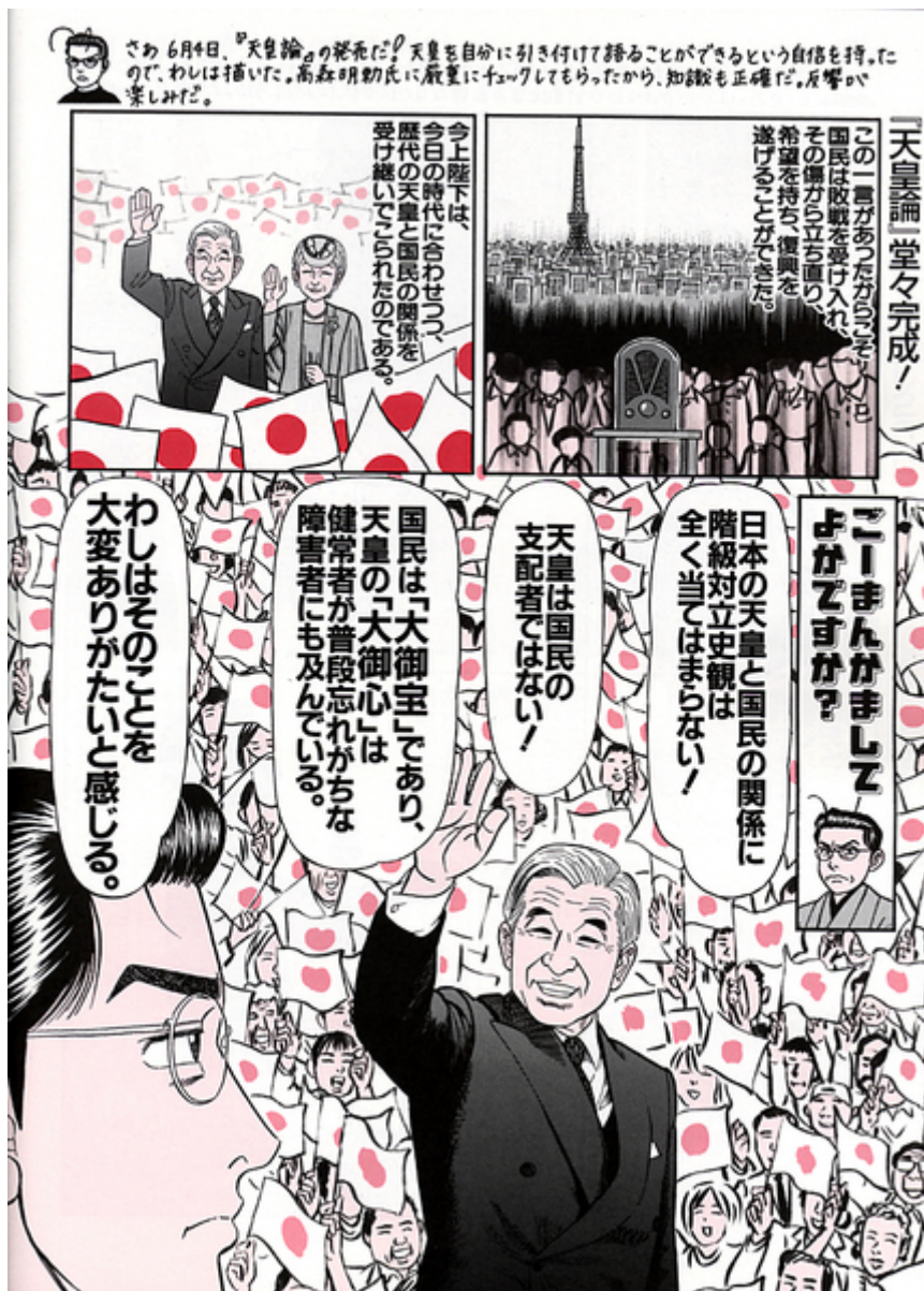
昔に比較すると「絵」が上手くなりました。天皇陛下の描写など合格点です。