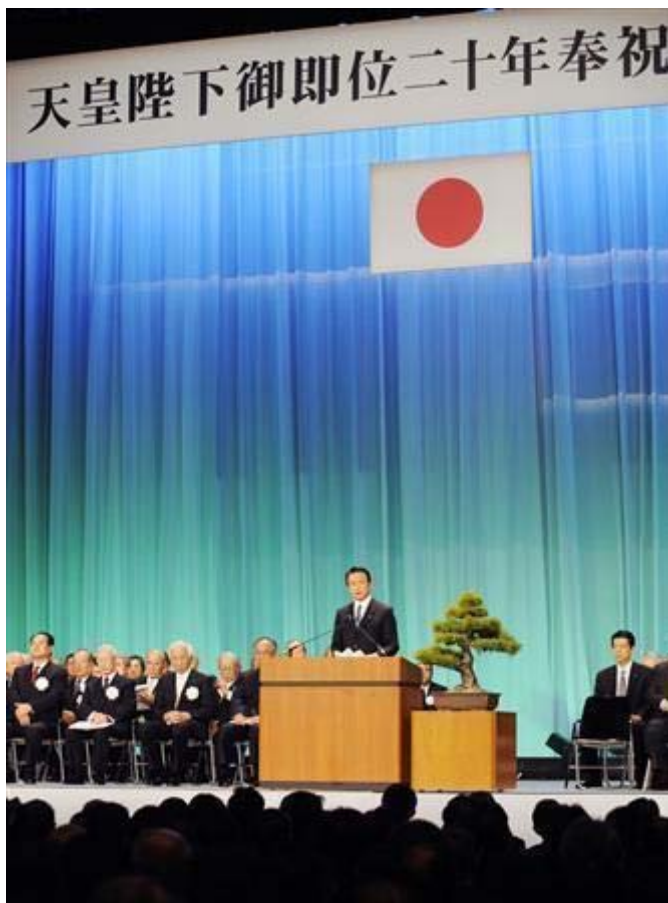
式典で挨拶する 麻生太郎 内閣総理大臣

「正確に申し上げれば、両陛下のおかげで障害者福祉が大きく前進したと言っても過言ではありません」。