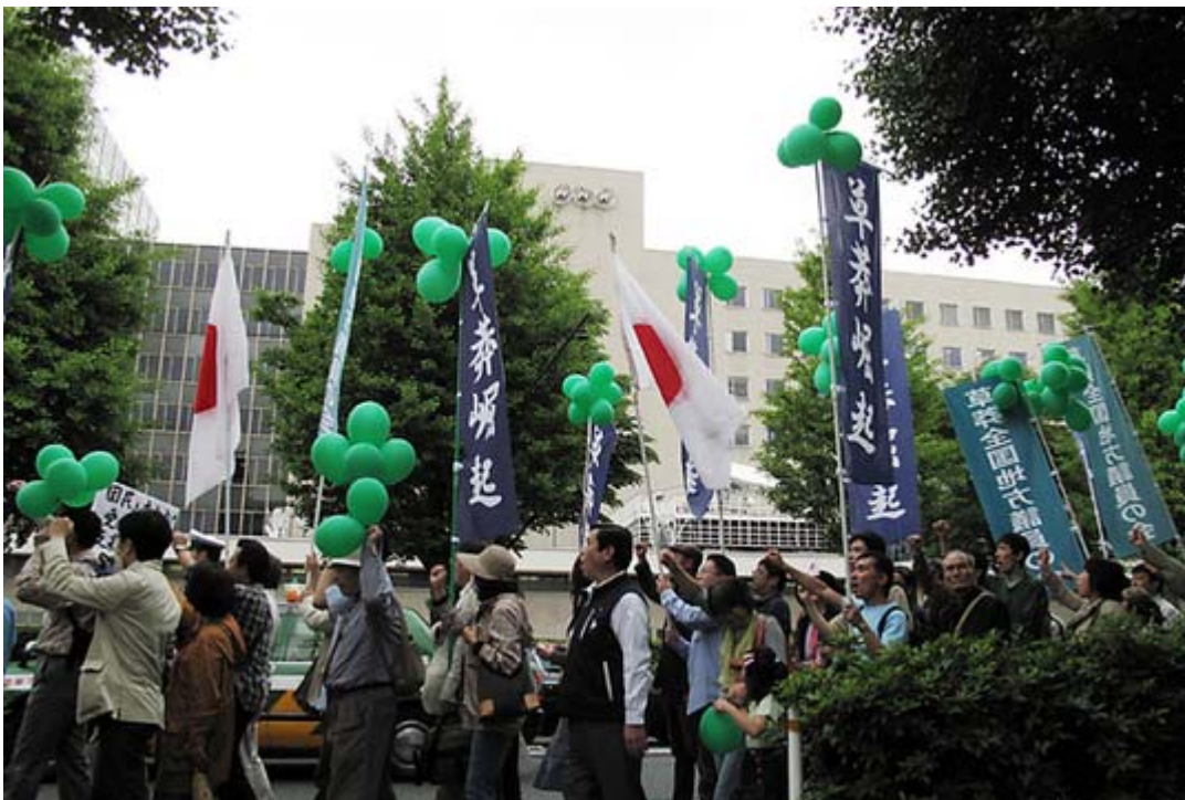
NHK前のデモ隊はシュプレヒコールを一段と声高らかに叫びました。