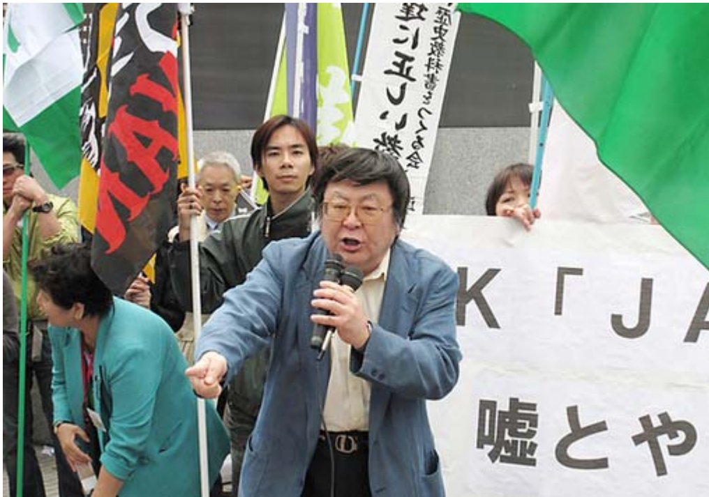
最強のアジテーター三輪氏が登場すると参加者も戦闘モードに切り替わります。