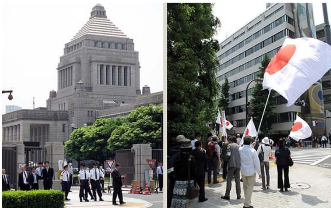
何事と警戒する議事堂の警備陣、 民主党 まえでの抗議街宣の様子