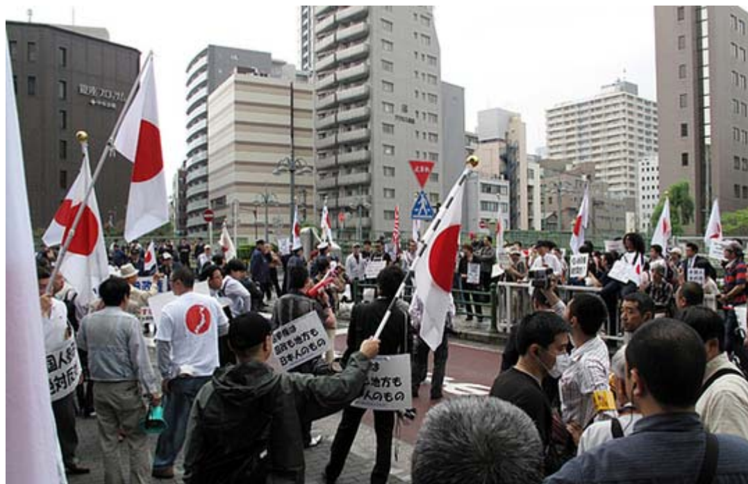
民団の集会会場まで怒りの抗議集会が盛大に開かれた

民主党が政権を取れば真っ先に成立させるであろうと言われているのが「外国人参政権」ですが、民団青年部主催による「永住外国人に地方参政権を！5・31集会」が昨日、午後二時から銀座ブロッサムで開催されました。これを阻止しようと「外国人参政権を求める民団へ日本国民怒りの抗議活動」が午後一時から中央区民会館前で約200人(主催者発表)を集めて盛大に開催されました。