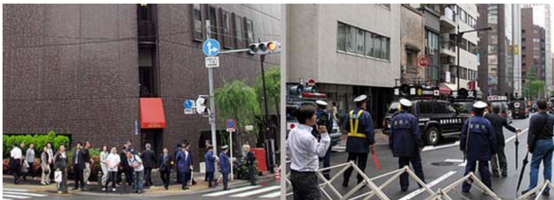
何事とこちらを何う在日、街宣車の騒音は半端ではなかったです

この時間帯に設定したのは、午後二時から始まる集会に在日が会場に行く途中に抗議をしようという狙いで、明らかに在日と判る韓国人に抗議をすると驚いた様子。中にはお年寄りのおばあさんが大声で向かってくるシーンもありました。