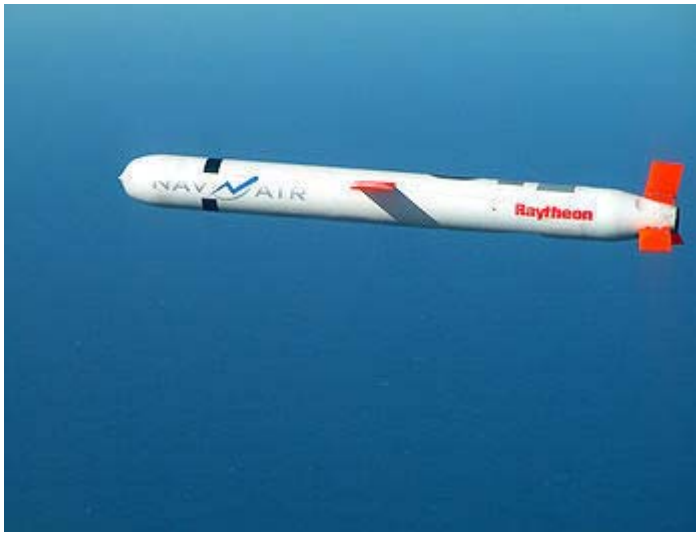
敵地攻撃として自民党の国防関係合同会議が提言したトマホーク型巡航ミサイル

しかし、日本の防衛体制はあまりにも専守防衛ということで、普通の国なら当然とされることが日本では出来ないことが多すぎる、ということは皆さん、ご承知の通りです。