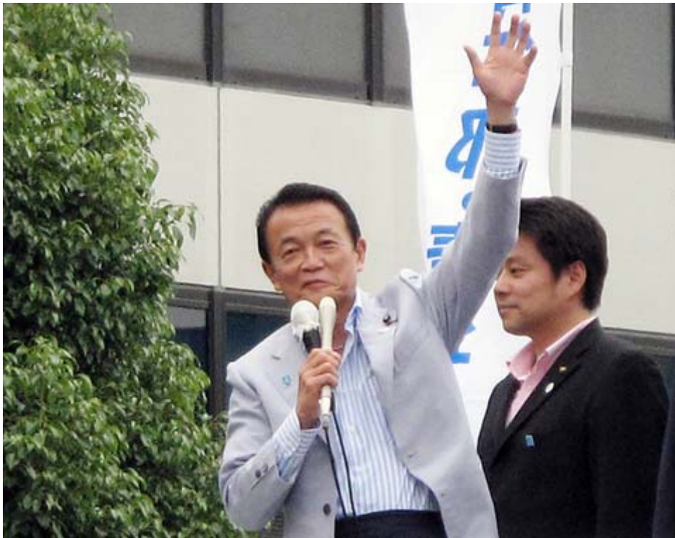
この明るい笑顔で強いリーダーシップを発揮して欲しい、そういう麻生さんを国民は支持するだろう

二つとも、もっともな提言であり、政府は直ちにこれを全部丸飲みして実行に移すべきです。 村山談話 、 河野談話 に代わる自虐史観を排した「 麻生談話 」を発表し、同時に 集団的自衛権 は行使可能と閣議決定する。