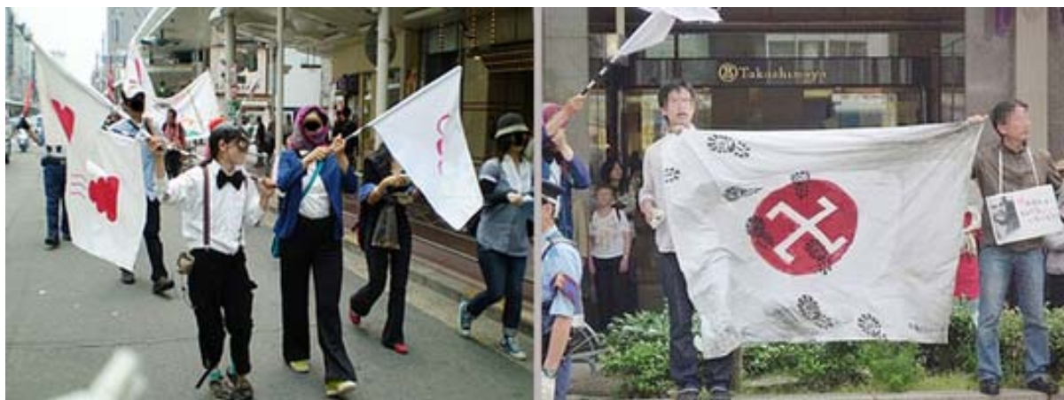
左は厳選！ 韓国情報さん 、右はよーめんさんのブログからお借りました。殿り込みかけたい気持ちです。

普通、永年、日本で住んでいてこのように日本の国旗を侮辱し、日本をここまで貶める行動を取るときは、日本での生活を諦め、母国に帰るに当たって「悪意のアカンベ」なら判ります。このような事をすれば、当然、普通の日本人から総スキャンを食うことは目に見えていますからね。