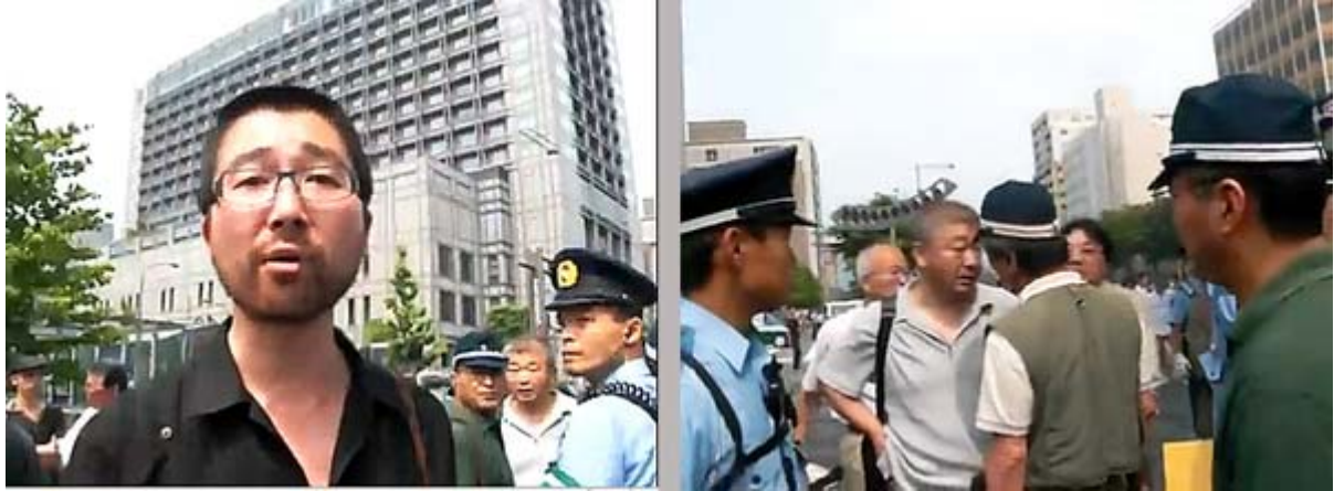
dai-nippon さんの動画から、これが可愛そうな在日に見えますか？。

ところが、反日の在日暴力左翼の面々は、ここまで日本を嫌い、日本人の怒りを焚きつけておいて「日本の参政権よこせ！」と騒いでいるのです。この構図は、終戦直後に突然「俺たちは戦勝国人だ！」といて、暴力で多数の日本人を殺傷・強姦し、駅前の一等地を非合法に略奪した当時とそっくりではないですか？。