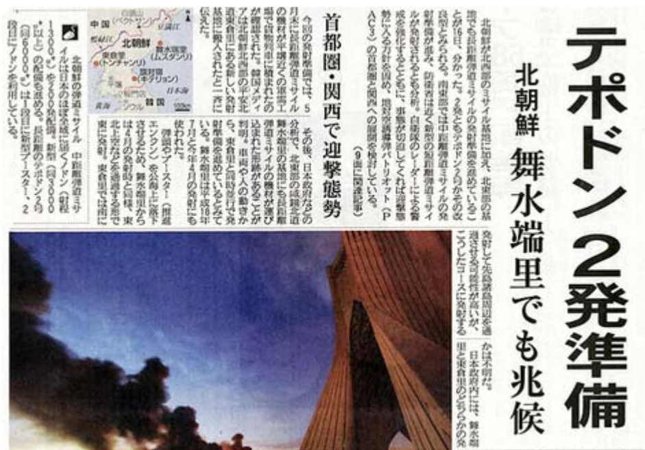
北朝鮮の二発の弾道ミサイル発射を一面トップで伝える17日産経新聞朝刊

今朝の産経新聞は一面トップで「テポドン2発準備」、「首都圏・関西で迎撃体制」という記事が大々的に掲載されています。私は日本が普通の国になるためには、核武装は当然だと思いますが、これを最近「16段階で進めよう」と繰り返し訴えているのが日下公人氏です。