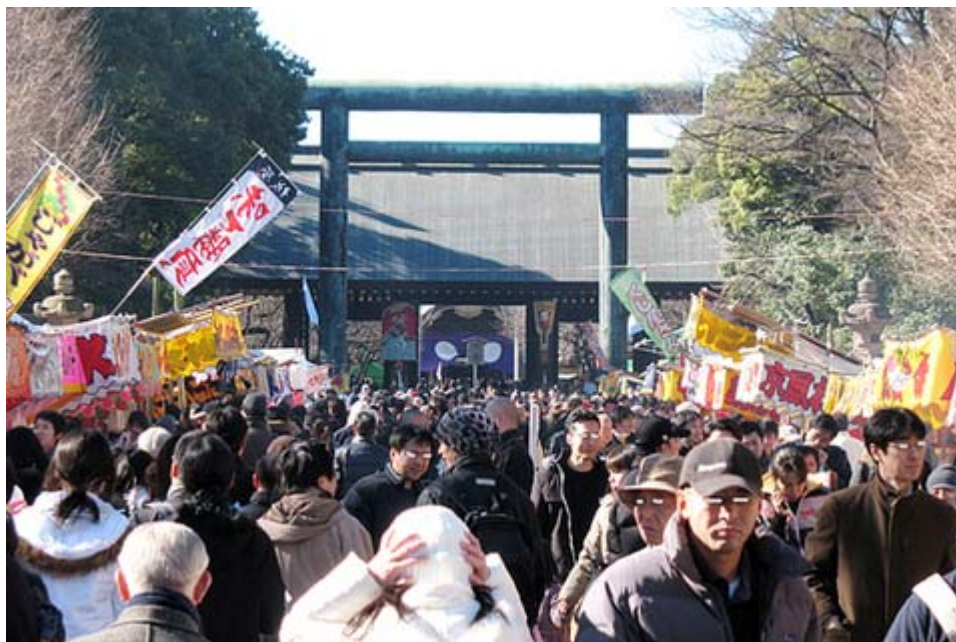
日本の風景、初詣で賑わう 靖国神社 (2009年1月2日撮影)

っている。また「野田、前原、渡辺、松原、長島氏ら若手のしっかりした政治家の考え方が、 民主党 内でどのような地位を占めるのか占めないのかは、重要な問題です」とも指摘している。さて、貴方ならどちらの考えを支持するか？私は文句なく櫻井さん支持だ。