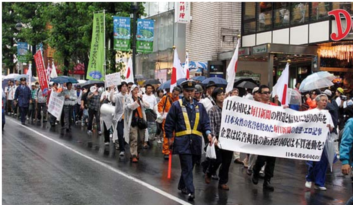
NHK方面から公園通りを下るデモ隊の一行

毎日新聞社が、インターネットの自社サイト毎日新聞英語版にて、少なくとも9年以上にわたり日本人に対する誤解を招くような記事を英語で全世界に向けて配信していたという事件が表面化してから一年が経過しました(内容はとても恥ずかしいので活字化がはばかれます)。