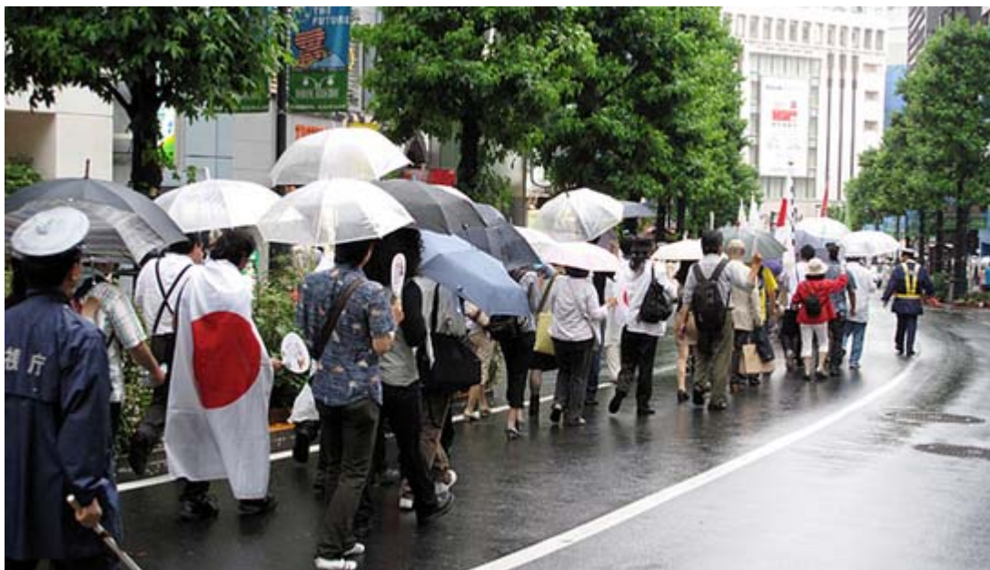
デモには女性の参加者も多かったです

集まったのはハチ公前の抗議街宣で約50人、宮下公園のデモ出発時で100人を超えており(公安関係者の集計)、雨にもかかわらずその後の参加者も増えてかなりの数に上りました。