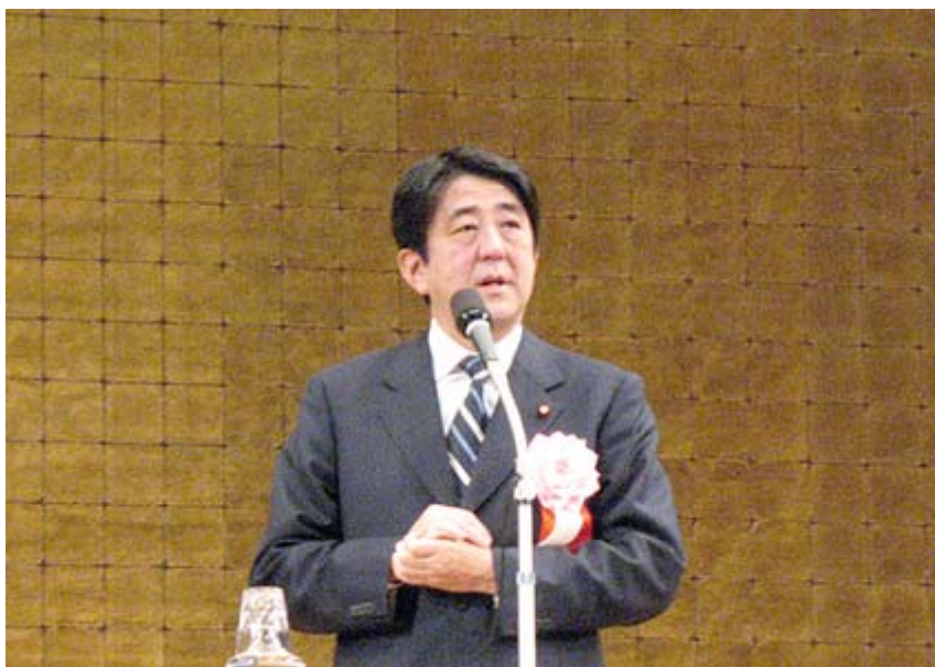
建国記念日で記念講演する安倍晋三元総理大臣(2009年2月11日、明治神宮会館で撮影)

・安倍さん、よくぞ言ってくれました。 民主党 の都合の悪いニュースを流さないというマスコミの偏向報道をズバリ指摘してくれました。いいですね～。