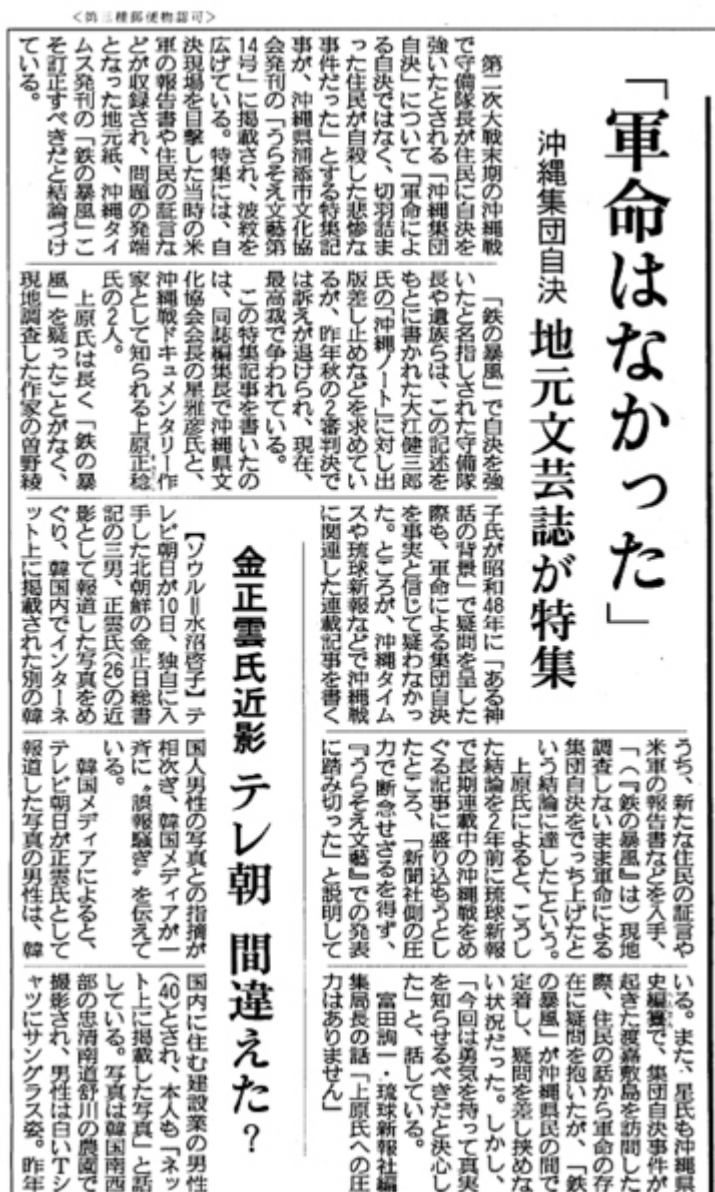
6月11日の産経新聞朝刊はかなり大きく報じています

特集には、自決現場を目撃した当時の米軍の報告書や住民の証言などが収録され、問題の発端となった地元紙、沖縄タイムス発刊の「鉄の暴風」こそが訂正すべきと結論づけている。