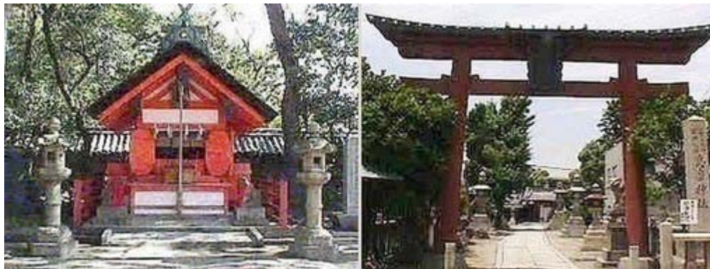
住吉大社摂社の船玉神社(左)と志摩神社、神奈備さんのHPから

漁師たちは再び船橋を飛び出し、暗い海を見つめる。目を凝らし、サーチライトはもちろん、小さな懐中電燈まで動員した。だが、一時間は瞬く間に過ぎ、船長が「捜索中止」を命じた。