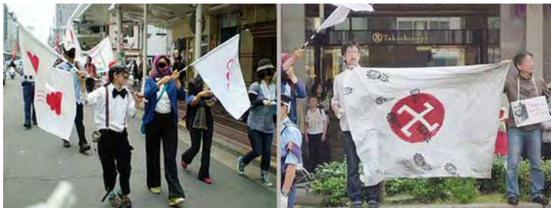
詳しくは「日の丸はウンコ!!!」をご覧ください

で、我々が一番問題としている「外国人参政権」を要求しているのがこういう人達です。民主党、公明党ほか野党は、こんな不逞の輩、世が世なら逮捕拘束されても文句の言えない言動をしている連中に、参政権を差し出そうとしているのです。気は確かか！と問いたいですね。