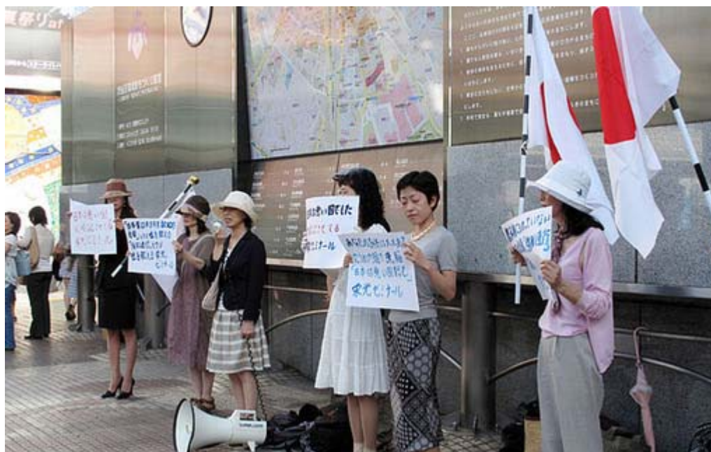
女性ばかりのこういう光景ははじめてみました。いいですね～。

同会のホームページによれば、「この会は一人でチラシを作りポスティングしている方や一人で抗議に参加している女性が集まって出来た会です。やはり一人で活動するには勇気がいります。また一人よりも二人、三人と集まると心強くパワーも倍増します」としています。