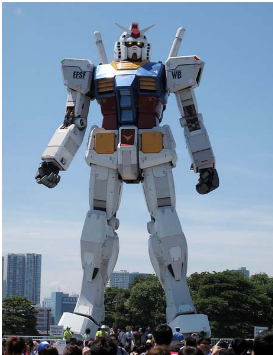
ガンダム 出番だ！ 日本の危機だ、国を護れ、頼んだぞ！

・これ、「 全ての日本人に告ぐ！民主党の正体 」(選挙ドットコム)の動画の台詞です。繰り返しますが、今度の選挙は「自民か民主か」ではありません。「日本か、反日か」、ニッポンの生死を決める選挙です。「一度くらい」などと気楽な気持ちの貴方の一票が、日本を終わらせるかも知れないのです。頑張ろう、ニッポン！。