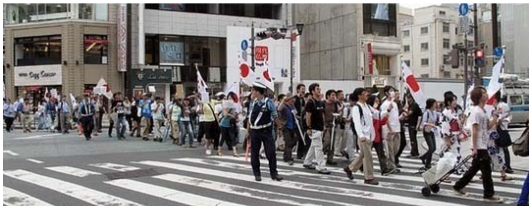
デモ出発当初は雨は降っていませんでしたが、しばらくして降ってきました。

銀座の水谷橋公園から日比谷公園まで、下記のシュプレヒコールを叫びながらデモ行進しましたが、銀座プランタンなど繁華街近くでは確実に足を止めて聞き入る一般の方が数多く見られました。