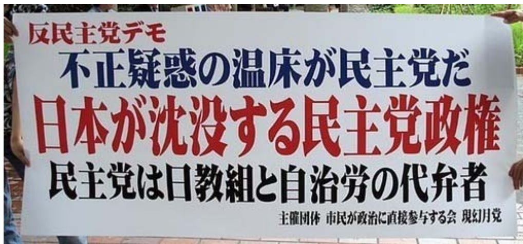
デモの横断幕に使われた「日本が沈没する 民主党政権 」。 民主党 の反論を期待したいところです。