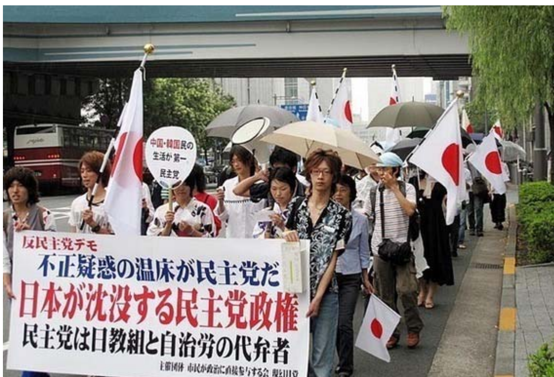
反民主党デモ、なんて史上初めてではないでしょうか？

日教組や年金を吹き飛ばした自治労を腹の中に抱える民主党に、我々の生活が任せられますか！。そして積み立てを行っていない人に年金をばらまこうという民主党を許せますか！(許せない、ふざけんな！)。