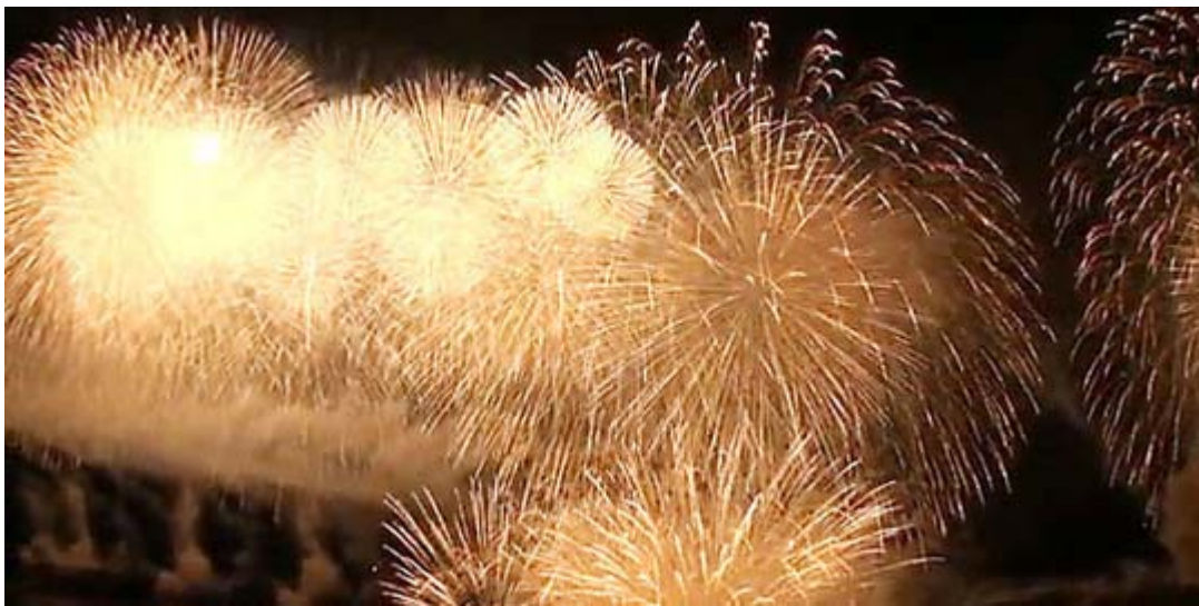
柏崎海上花火大会から

その中で生み出された歌舞伎や浮世絵などオリジナルな文化は、今も世界中で高く評価されている。庶民の道德心も高く、幕末に日本を訪れた欧米人が日記などで一様に絶賛しているところである。