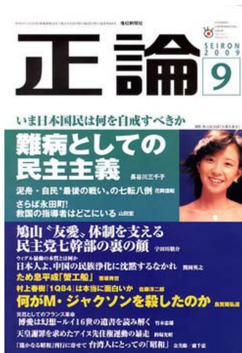
正論九月号は680円で好評発売中です。

個人的な思いですが、私自身は松下政経塾出身の政治家ではこの山田宏氏をもっとも高く評価しています。日本新党の議員として五年勤めた後、杉並区長に転身したわけですが、財政改革や教育改革などで独自の区政を展開し、ある意味地方自治の模範と評価されています。