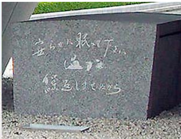
平和記念公園と問題となっている主語のない「石碑」