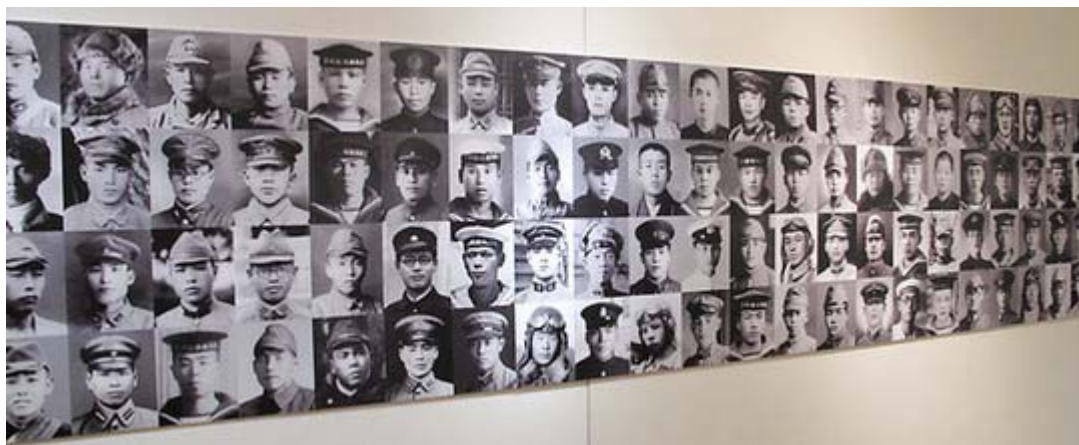
靖国神社では「矢弾丸尽きるとも」展が開催されています。